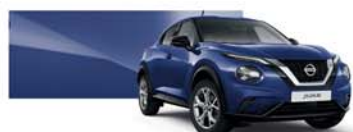
Ink Blue (M) - RBN