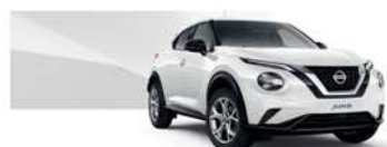
Solid White (S) - 326