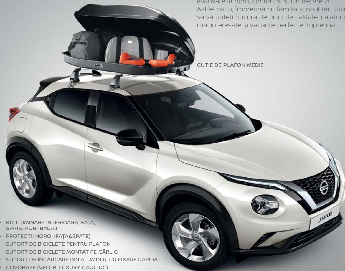
CUTIE DE PLAFON MEDIE

La fel ca noul tău JUKE, gama de accesorii este concepută pentru a-ți aduce tehnologii avansate la bord, confort și stil în fiecare zi. Astfel ca tu, împreună cu familia și noul tău Juke să vă puteți bucura de timp de calitate, călătorii mai interesate și vacanțe perfecte împreună.