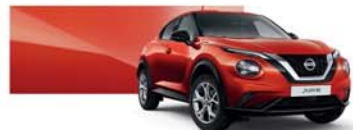
Fuji Sunset (M) - NBV