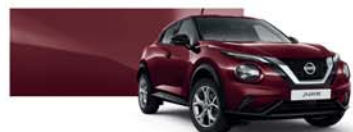
Burgundy (M) - NBQ