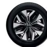
Jante 17" Sakura Design