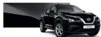
Black Metallic (M) - Z11