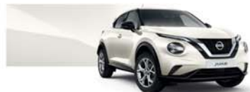
Pearl White (P) - QAB