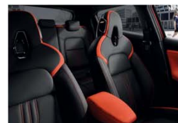
PACHET N-DESIGN ORANGE Energy Orange/ Tapițerie mixtă piele și piele ecologică