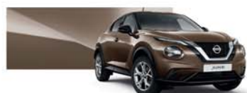
Chestnut Bronze (M) - CAN