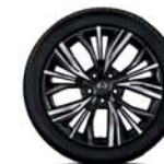
Jante 19" Akari