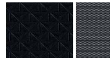
N-CONNECTA STANDARD Textil negru în relief / Textil gri