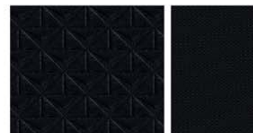
ACENTA & VISIA STANDARD Textil negru în relief / Textil negru