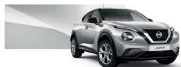
Blade Silver (M) - KYO