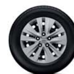
Capac roată 16"