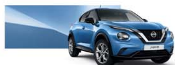
Vivid Blue (M) - RCA