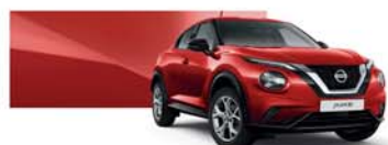
Solid Red (S) - Z10