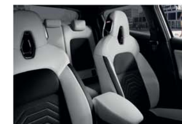
PACHET N-DESIGN ALB Light Grey / Tapițerie mixtă textil și piele ecologică