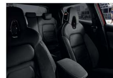
PACHET N-DESIGN NEGRU Enigma Black/ Tapițerie mixtă piele și Alcantara®