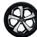
Jante din aliaj 19"