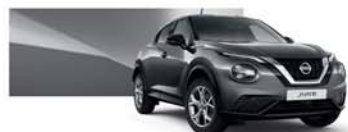
Gun Grey (M) - KAD