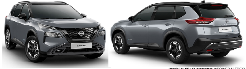
imagini cu titlu de prezentare (ePOWER N-TREK)